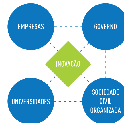
Figura 1 - Representação do modelo quádrupla hélice de stakeholders

Tomando-se por base a materialidade figurada neste relatório e o exercício de mapeamento de riscos com 52 representantes da sociedade civil (G4-2), foi traçado por esses especialistas um modelo genérico e simplificado de stakeholders, chamado de “quádrupla hélice”* (Figura 1).